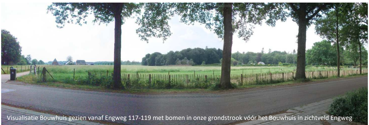
Visualisatie Bouwhuis gezien vanaf Engweg 117-119 met bomen in onze grondstrook vóór het Bouwhuis in zichtveld Engweg

Wij zijn bereid om groenblijvende bomen te planten op onze grondstrook buiten de muur, zodat omwonenden het Bouwhuis uiteindelijk nauwelijks meer kunnen zien.