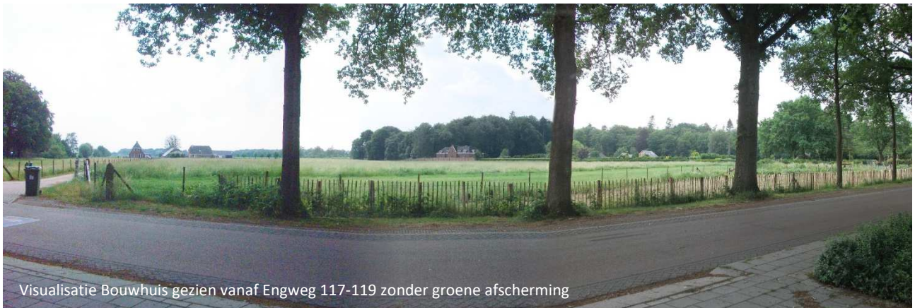
Visualisatie Bouwhuis gezien vanaf Engweg 117-119 zonder groene afscherming

Enkele bewoners van de Engweg en Gooyer Wetering hebben laten weten zich zorgen te maken over het uitzicht vanuit hun woning. Wij hebben visualisaties laten maken van het uitzicht op het Bouwhuis zoals wij dat willen laten bouwen op ons terrein. Het Bouwhuis komt aan de rand van de buitenplaats, zodat wij de historische landschapstuin weer in ere kunnen herstellen en alle monumentale bomen kunnen sparen.